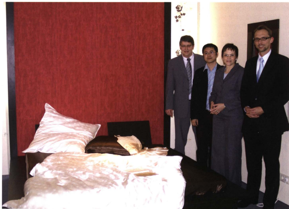
Firmenbesuch Sichou GmbH

Auch 2008 ist es gelungen, einen großen Teil der Anfragen direkt zu beantworten. Konnte das Anliegen eines Unternehmens einmal nicht geklärt werden oder war die EWG nicht der richtige Ansprechpartner, ist der Kontakt zu den richtigen Ansprechpartnern hergestellt worden – egal ob im Rathaus oder bei externen Institutionen, Vereinen oder Unternehmen.