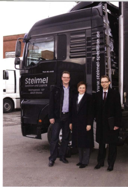
Firmenbesuch Kurierdienst Steimel GmbH